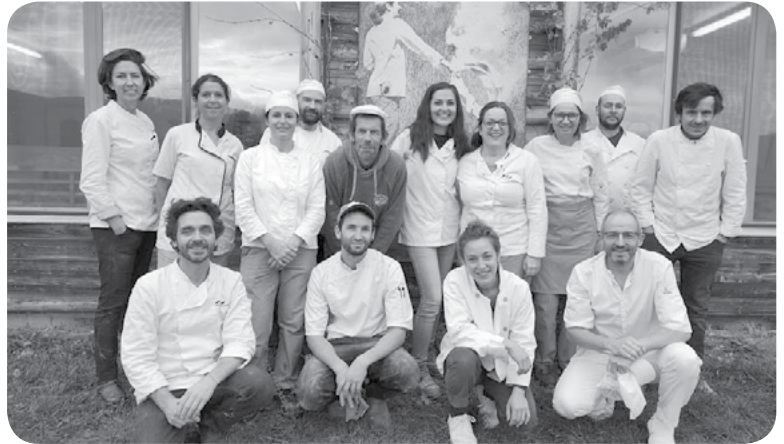
Les stagiaires de la session d'août 2021 - Bravo à eux !