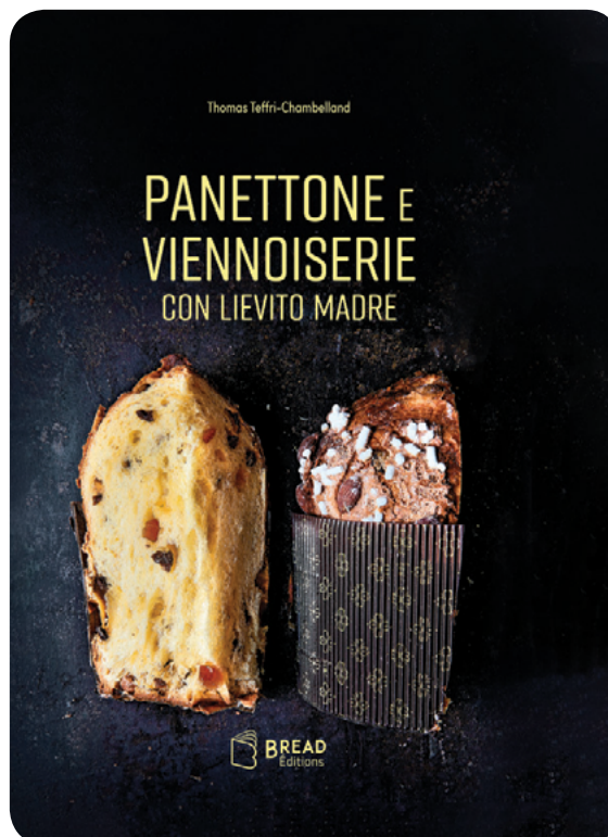
Couverture de nouveau livre en italien