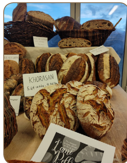
Tables des FABB 2022