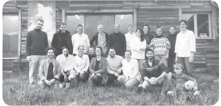
Les stagiaires de la session de janvier 2022

Vous trouverez la procédure d'inscription sur notre site internet, ici