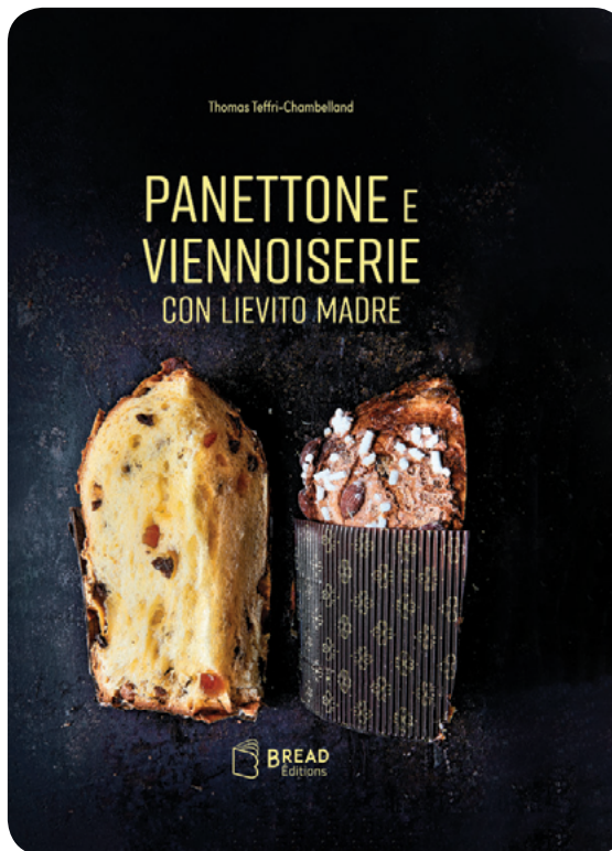
Couverture de nouveau livre en italien